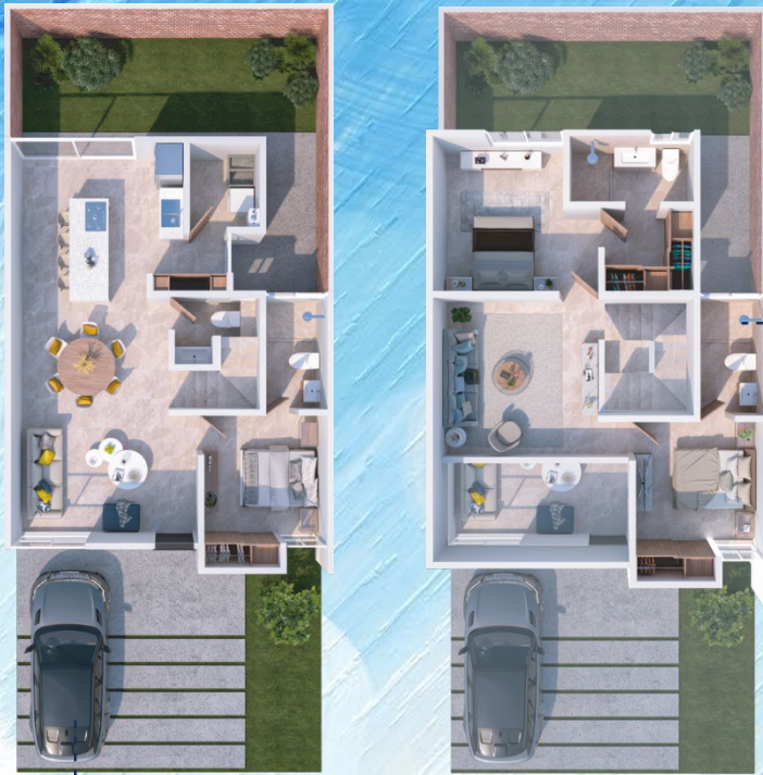
▲ Planta Baja