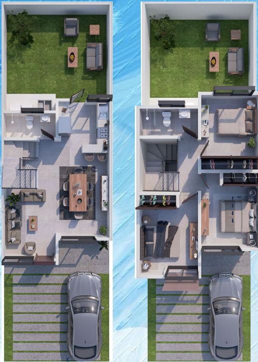
◀ Planta Alta