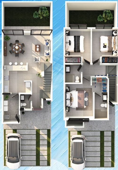
◀ Planta Alta

- 3 Recámaras Baño independiente * Rec. Ppal. con baño y vestidor.