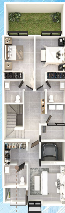
▲ Planta Alta