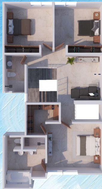
◀ Planta Alta