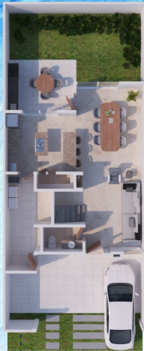
▲ Planta Baja