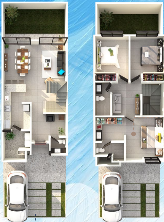
◀ Planta Alta